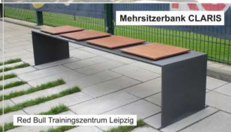
Red Bull Trainingszentrum Leipzig