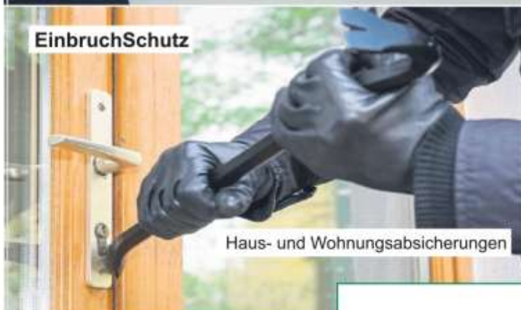
Haus- und Wohnungsabsicherungen