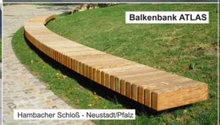
Hambacher Schloß - Neustadt/Pfalz

Entwurf, Entwicklung, Gestaltung, 3D-CAD-Konstruktion und Fertigung von Möbierungselementen für den öffentlichen Raum ... made in Kiel