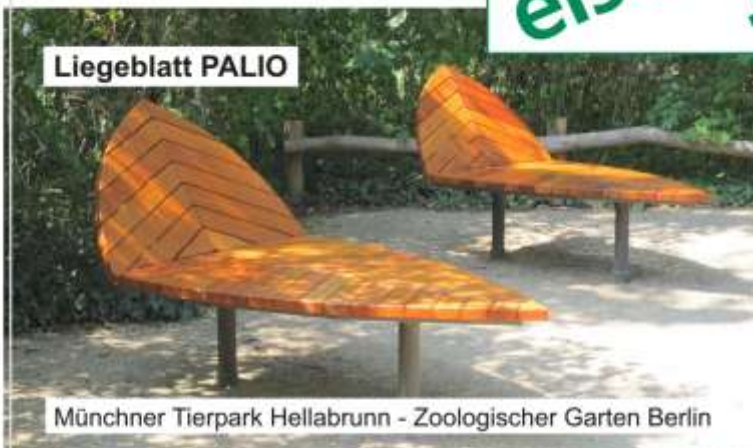
Münchner Tierpark Hellabrunn - Zoologischer Garten Berlin