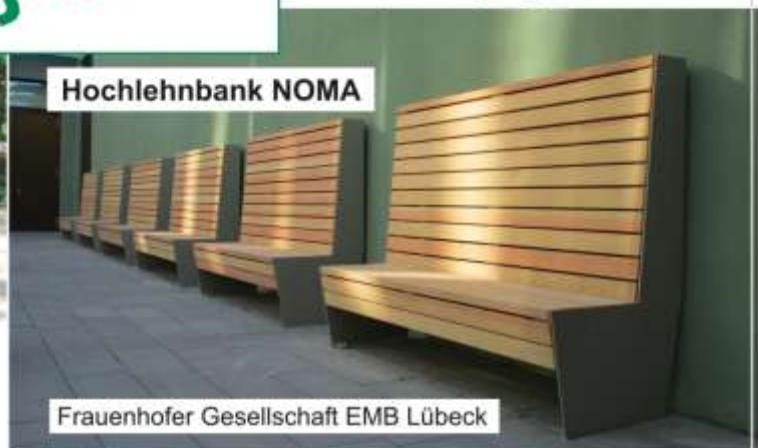
Frauenhofer Gesellschaft EMB Lübeck